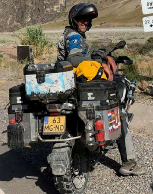
De grens met Afghanistan