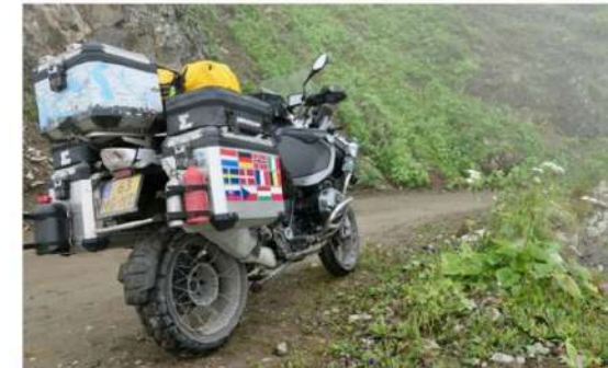
D915 in Oost Turkije

De eerste kilometers van een reis vind ik altijd het moeilijkst. De voorgaande dagen ben je in je hoofd alleen maar bezig met de finale beslissingen over wat mee te nemen en wat niet, visa, verzekeringen, onderhoud motor, bandenkeuze, kleding en nog duizend-en-een zaken. Ook is daar het moment vlak voor je je helm opzet, dat je vrouw een kus geeft en je de zorgen in haar ogen ziet of alles goed zal gaan. Toch, als je de motor langzaam door de versnellingen begeleidt, je langzaam weer gewend reakt aan het gewicht, de eerste bochten vertrouwd aanvoelen, dan maakt het gevoel van afscheid nemen langzaam plaats voor het reizigersgevoel. Het plan is om deze keer twee tot drie maanden onderweg te zijn en naar het oosten te rijden, naar de grens met Afghanistan en China.