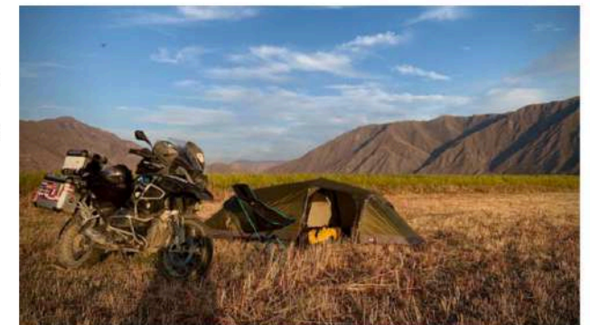
Wildkampen ergens in Kirgizië

Tijdens zo'n reis stroomt je hoofd langzaam maar zeker vol met ontmoetingen, landschappen en ervaringen. In Turkije volg ik een aantal dagen de mythische rivier de Eufraat die door het landschap kronkelt. Ik wil eigenlijk het Koerdische deel van Irak in, maar de dagelijkse temperaturen van tegen de 40 graden dwingen me naar het noorden. Reizen zonder vastemlijnd plan heeft zijn voordelen. Ik zet regelmatig mijn tentje op, ergens verscholen van de openbare weg. Op één van die dagen kruip ik mijn tentje in als het donker wordt. Ik lig nog maar net als ik een paar stemmen buiten de tent me hoor aanspreken. Ik steek mijn hoofd naar buiten en tref een paar boerenzonen die even komen checken of alles goed is.