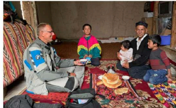
Uitgenodigd voor de thee bij een gezin thuis (Tadzjikistan)

Variëert Rusland ben ik Kazachstan ingegaan en vervolgens Oezbekistan. De Kyzylkum woestijn is de op tien na grootste woestijn ter wereld en de afstanden zijn immens. Het is heet en er staat een snoeiharde wind van rechts. Mijn nekspieren draaien overuren om mijn hoofd recht te houden. Ik geniet van de uitgestrektheid, afstanden tussen plaatsen zijn zomaar 450 kilometer. Het heelt iets meditatiefs en er is volop denktijd aan de binnenkant van mijn helm. In twee weken tijd heb ik bijna niemand gesproken en ik heb inmiddels wel wat zin in gezelschap. Ik nader Khiva, een kleine woestijnstad die in het verleden de grootste slavenmarkt van Centraal-Azië bezat. De ondergaande zon werpt een onwerkelijke gloed op de vestingwal en de toegangspoort. In combinatie met de zwoele avondtemperatuur voelt het magisch aan, niet te vergelijken met ook maar één piek waar ik ooit eerder ben geweest. Ik check in bij een guesthouse en tref daar ander motorrijders. Met een man of zes gaan we uit eten en iedereen zit vol verhalen. Als het later wordt eindigen we op een dakterras met nog meer reizigers, verhalen en bier.