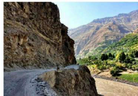
Tadzjikistan, in de verte zie je me rooij rijden