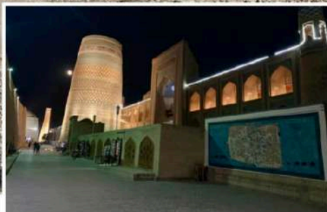
Khiva, Oezbekistan. Betoverend mooi woestijnstadje

“Het plan is om deze keer twee tot drie maanden onderweg te zijn en naar het oosten te rijden, naar de grens met Afghanistan en China.”