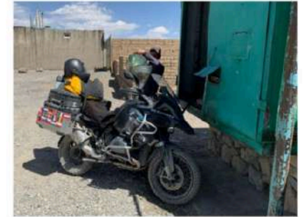
Turken in Centraal Azië. 80 Octaan op zijn best

De eerste kilometers van een reis vind ik altijd het moeilijkst. De voorgaande dagen ben je in je hoofd alleen maar bezig met de finale beslissingen over wat mee te nemen en wat niet, visa, verzekeringen, onderhoud motor, bandenkeuze, kleding en nog duizend-en-een zaken. Ook is daar het moment vlak voor je je helm opzet, dat je vrouw een kus geeft en je de zorgen in haar ogen ziet of alles goed zal gaan. Toch, als je de motor langzaam door de versnellingen begeleidt, je langzaam weer gewend reakt aan het gewicht, de eerste bochten vertrouwd aanvoelen, dan maakt het gevoel van afscheid nemen langzaam plaats voor het reizigersgevoel. Het plan is om deze keer twee tot drie maanden onderweg te zijn en naar het oosten te rijden, naar de grens met Afghanistan en China.